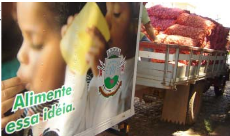
Instituições recebem mais de 25 toneladas de batatas