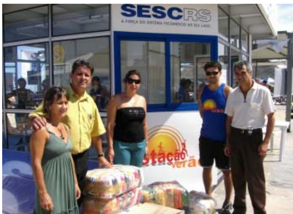
Torres: veranistas doam alimentos para participar das atividades

mento dos alimentos arrecadados. O SESC esteve presente na praia durante os meses de janeiro e fevereiro nas praias de Cidreira, Tramandaí, Atlântida Sul, Capão da Canoa, Arroio do Sal, Torres, São Lourenço do Sul, Cassino e Laranjal.