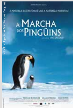
A Marcha dos Pinguins