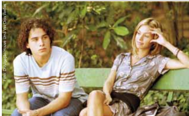
Houe Uma Vez Dois Verões

Local: Teatro SESC Av. Brasil, 30 Horário: 19h30