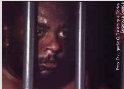
O Dia em que Dorival Encarou o Guarda

Local: Teatro SESC Av. Brasil, 30 Horário: 19h30