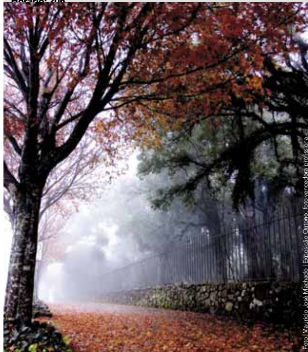
Exposição Outono, foto vencedora profissional