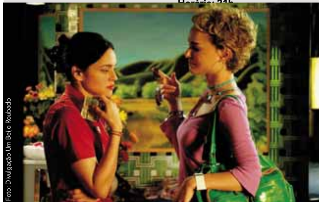
Um Beijo Roubado